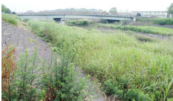
雑草が生い茂った花園川の河川公園

を流れる花園川は、親水型の河川公園として河川改修がされたが、現状では河川に降りて水に親しもうとしても、藪が生い茂り降りることさえできない。早急に