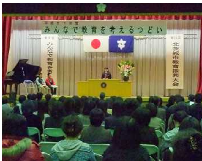
(精華小学校体育館、11月20日)

市教育振興大会が11月20日に開催されました。PTAや子どもたちも交えて地域に開く集まりとして「みんなで教育を考えるつどい」が始まって5回目、功労者への表彰、子どもたちの合唱や「夢」の発表、教師の研究報告などがおこなわれました。