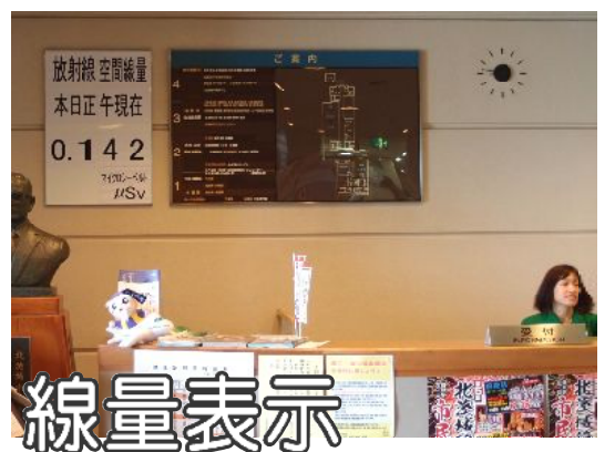
線量表示 市役所ロビーで、放射線量の現在値が表示されるようになりました。

北茨城上空を通過して同ルートに入っていくのかどうか明らかにしてほしい。これまでも爆音を響かせながら北茨城上空を低空で飛んでいくジェット機が見られた