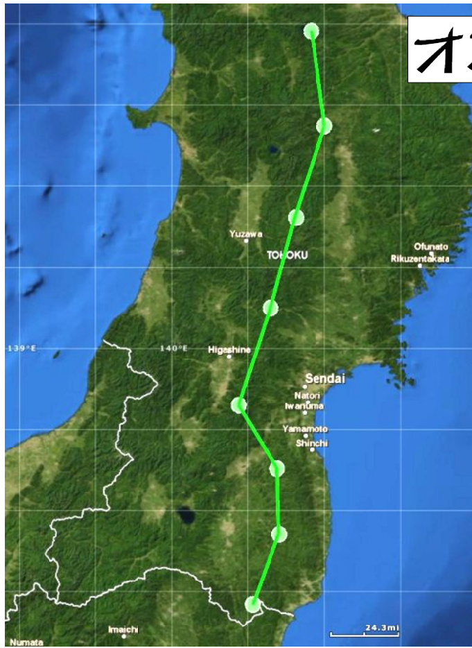
北茨城市の上空を飛行していく可能性も考えられる米軍の低空訓練ルートの一つ「グリーンルート」