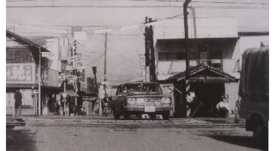
雨情記念館「写真で見る郷土の変遷～汽笛一声」展から(9/17まで開催)